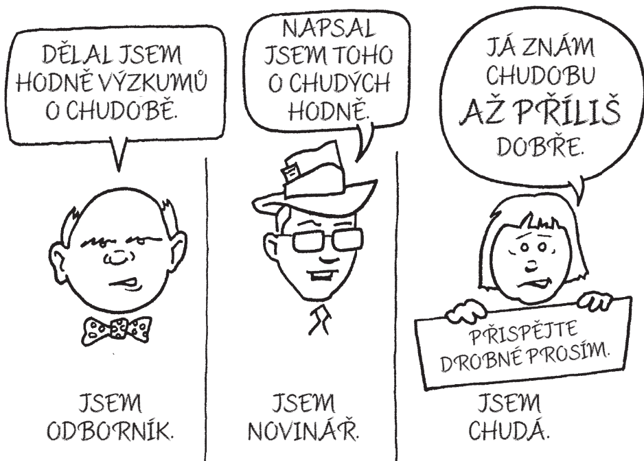
Obrázek: My všichni známe chudobu (Beresford, 2003, s. 14)