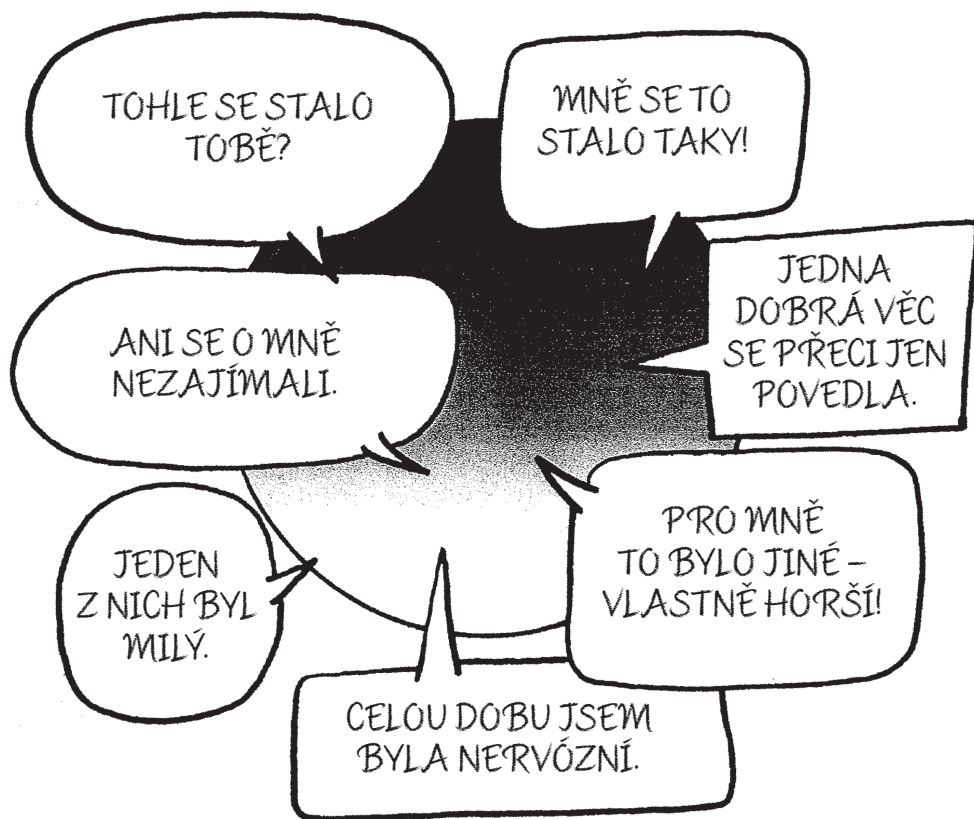
Obrázek: Budování společné znalosti (Beresford, 2003, s. 36)